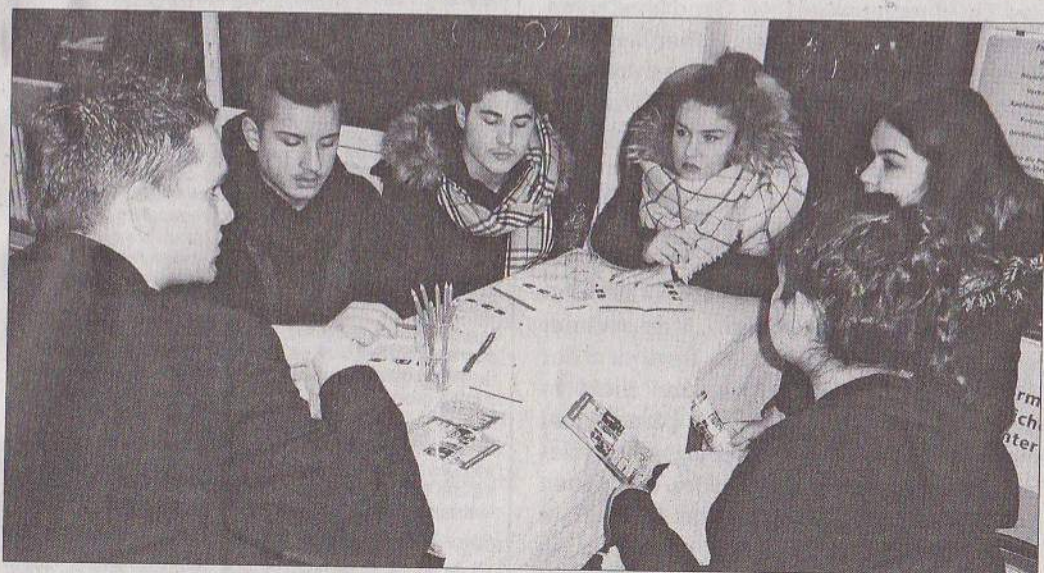
Schüler der 9. Klassen bei einem Beratungsgespräch.

Die gemeinnützige und unabhängige Stiftung „Gesellschaft macht Schule“ ist ein Zusammenschluss engagierter Bürger aus allen Bereichen der Gesellschaft, die sich seit 2002 für eine bessere Bildung einsetzt. Sie sehen Bildung als Lösungsschlüssel für die gesellschaftlichen Herausforderungen. Ihre Forderung: Bildung muss allen Kindern – unabhängig von ihrer Herkunft – zugänglich sein, wie es auf der Homepage der Stiftung nachzulesen ist. Deshalb wirkt „Gesellschaft macht Schule“ mit seinen Schulprojekten vor Ort, um so alle Kinder und Jugendlichen zu erreichen. Um langfristig den Herausforderungen gerecht zu werden, sind im Bildungssystem Veränderungen notwendig. mkr